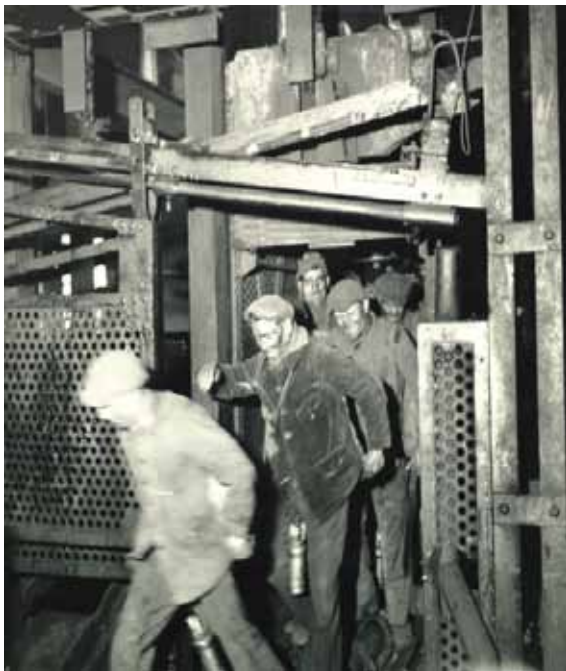
Mineurs sortant de la cage Tirage des Houillères du Bassin de la Loire