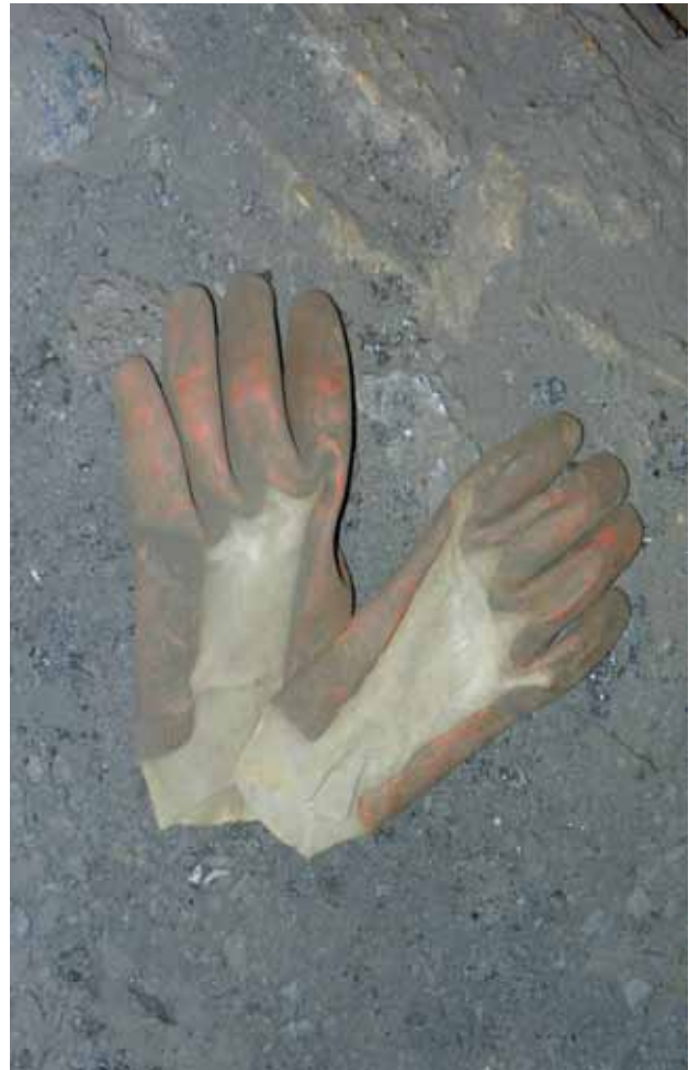
Les gants de protection