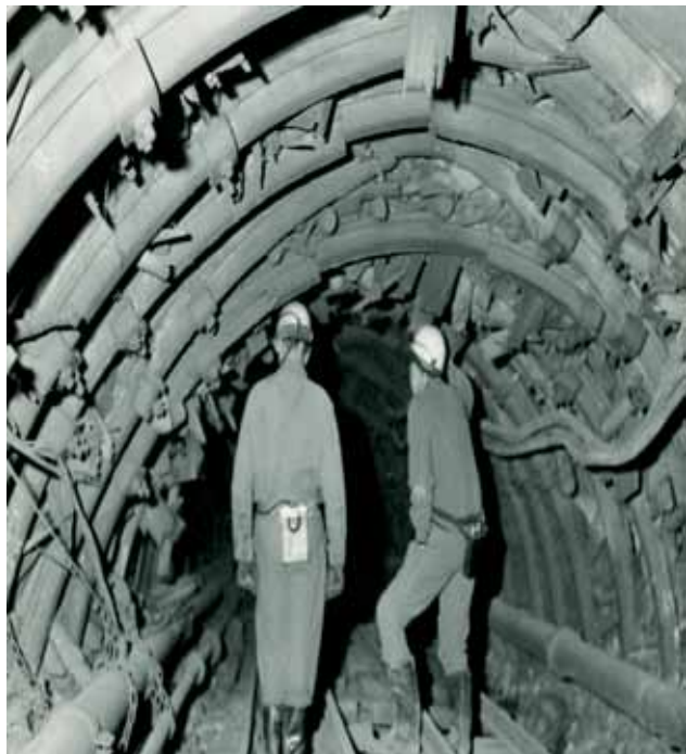
Mineurs dans un travers-banc Tirage des Houillères du Bassin de la Loire Puits Couriot / Parc-Musée de la mine