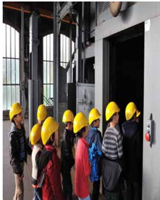
Les enfants en visite