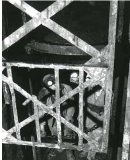
Mineurs attendant dans une cage Tirage des Houillères du Bassin de la Loire