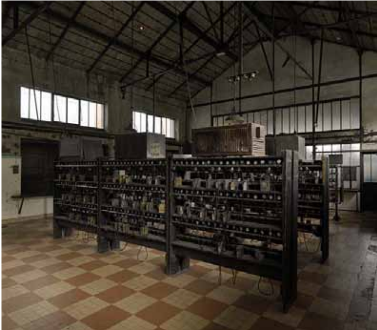
La lampisterie

Une fois le mineur habillé de son équipement de protection, il se rend dans la lampisterie afin de récupérer sa lampe qu'il accroche à son casque et à sa ceinture . Le voilà prêt pour descendre sous terre. Le poste commence !