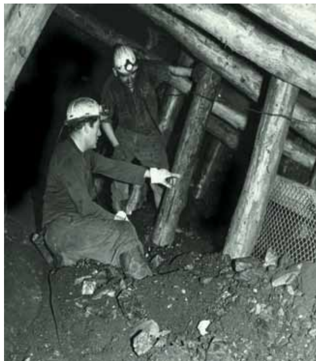
Mineurs sur un chantier d'abattage Tirage des Houillères du Bassin de la Loire Puits Couriot / Parc-Musée de la mine