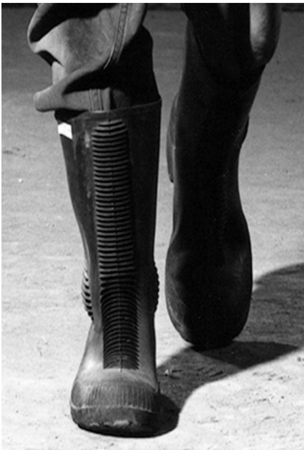
Les bottes de sécurité