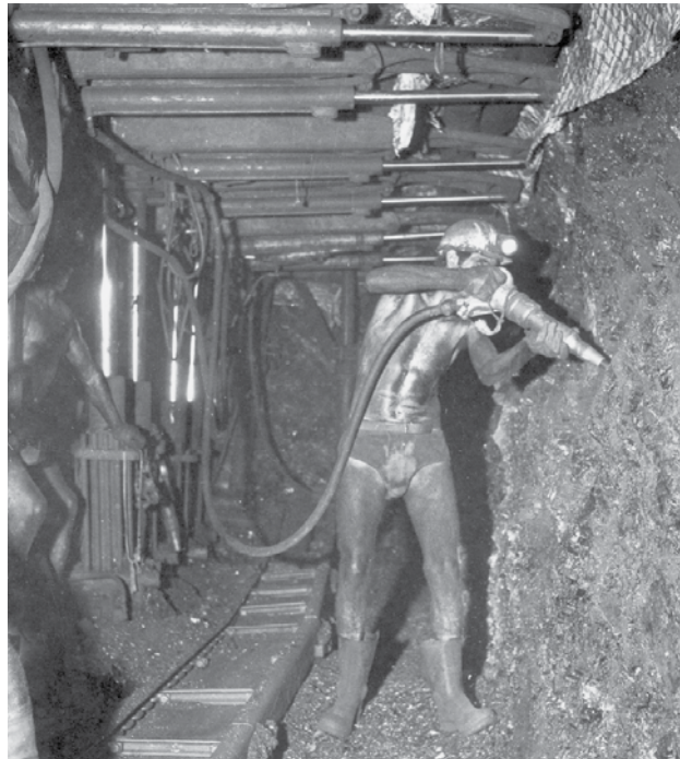
Piqueur sur le front de taille Tirage des Houillères du Bassin de la Loire Puits Couriot / Parc-Musée de la mine