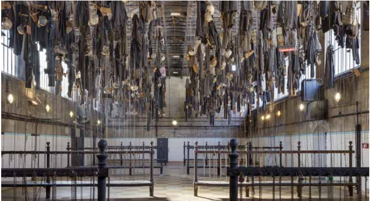
Le lavabo du Puits Couriot

Les élèves pourront toucher certains éléments de l'équipement du mineur après avoir fait descendre un panier.