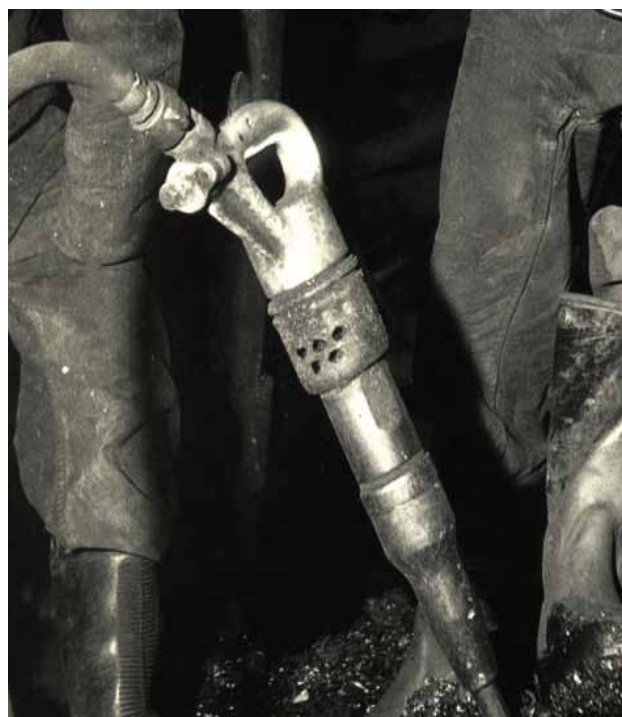
Marteau-piqueur / détail Tirage des Houillères du Bassin de la Loire Puits Couriot / Parc-Musée de la mine