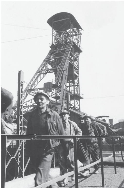
Mineurs remontant du fond au Puits Couriot Tirage des Houillères du Bassin de la Loire

Après une brève lecture de paysage avec l'aide d'anciennes photographies du site, les élèves arriveront à l'intérieur du chevalement : « la recette », lieu qui fait la lien entre le jour (la surface) et le fond (l'ensemble des galeries souterraines).