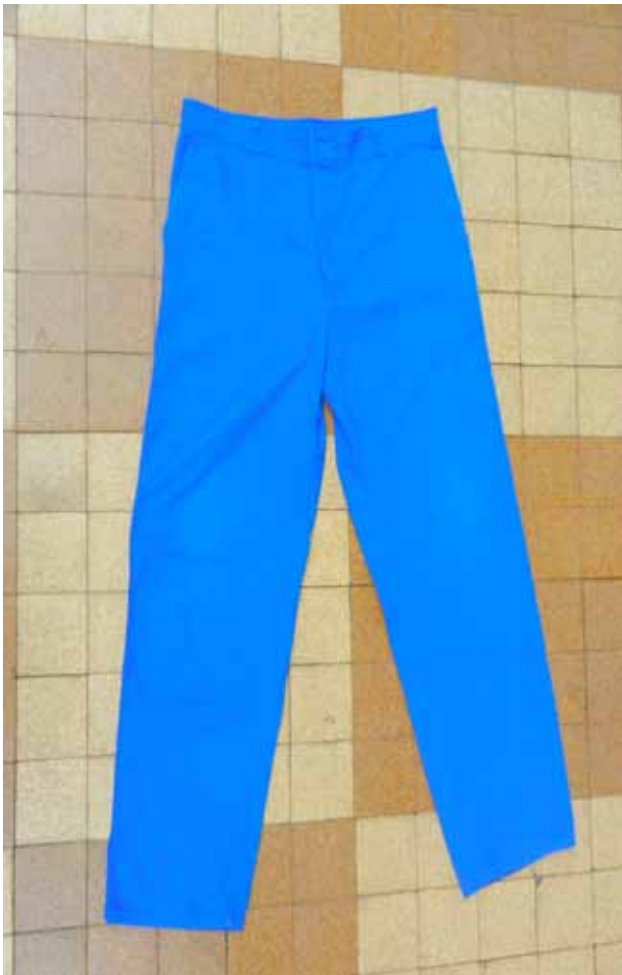
Le pantalon ou «bleu de travail»