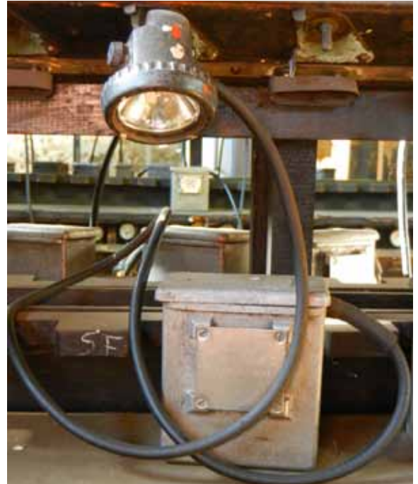
La lampe électrique Puits Couriot / Parc-Musée de la mine