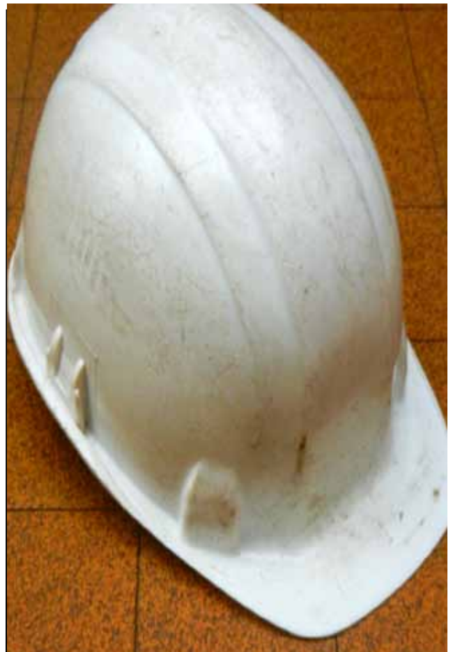
Le casque de sécurité