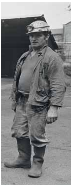
Silhouette d'un mineur de fond Puits Couriot / Parc-Musée de la mine