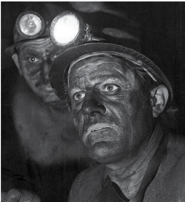
Des mineurs de fond Puits Couriot / Parc-Musée de la mine

Au cours de la visite, le médiateur allumera une lampe électrique afin que les élèves comprennent le fonctionnement.